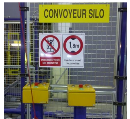
Consignes de sécurité