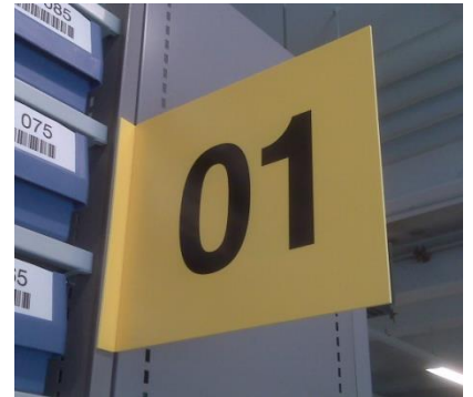
Pancarte drapeau recto/verso pliée