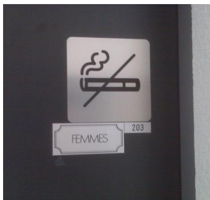
Interdiction de fumer