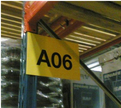
Zone de stockage