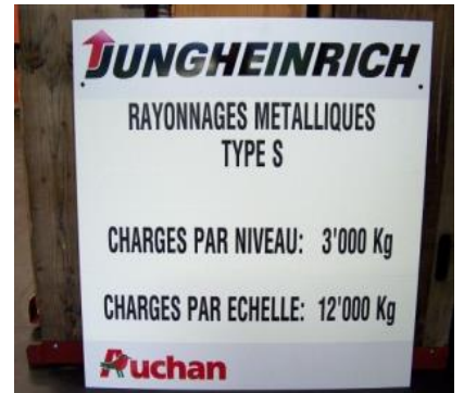
Pancarte logo société