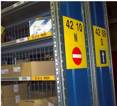
Sens de circulation