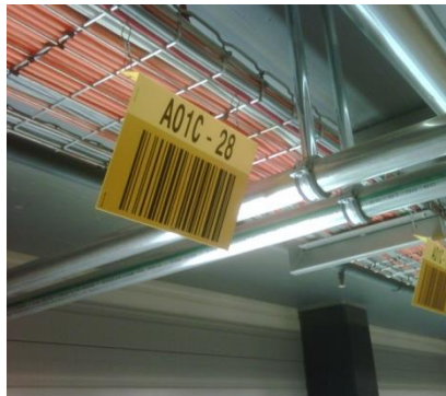
Pancarte code à barres accrochée à un câble